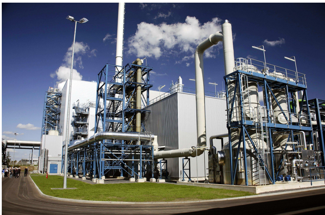
Impianto pilota di CCS a Jaenschwalde (Germania)

Le principali realizzazioni tecniche in materia di cattura di CO 2 a Compostilla (Spagna) riguardano la costruzione dell'impianto di sviluppo tecnologico di ossicombustione da 30 MW, che inizierà a funzionare nel corso di quest'anno. Le tappe fondamentali in materia di stoccaggio di CO 2 sono state l'analisi strutturale e gli studi strategici per la valutazione del sito e la caratterizzazione dei serbatoi. Si è proceduto a un'indagine sismica in 3D e all'acquisizione di dati magnetotellurici in 3D per determinare le caratteristiche del sito sotterraneo di stoccaggio di CO 2 .