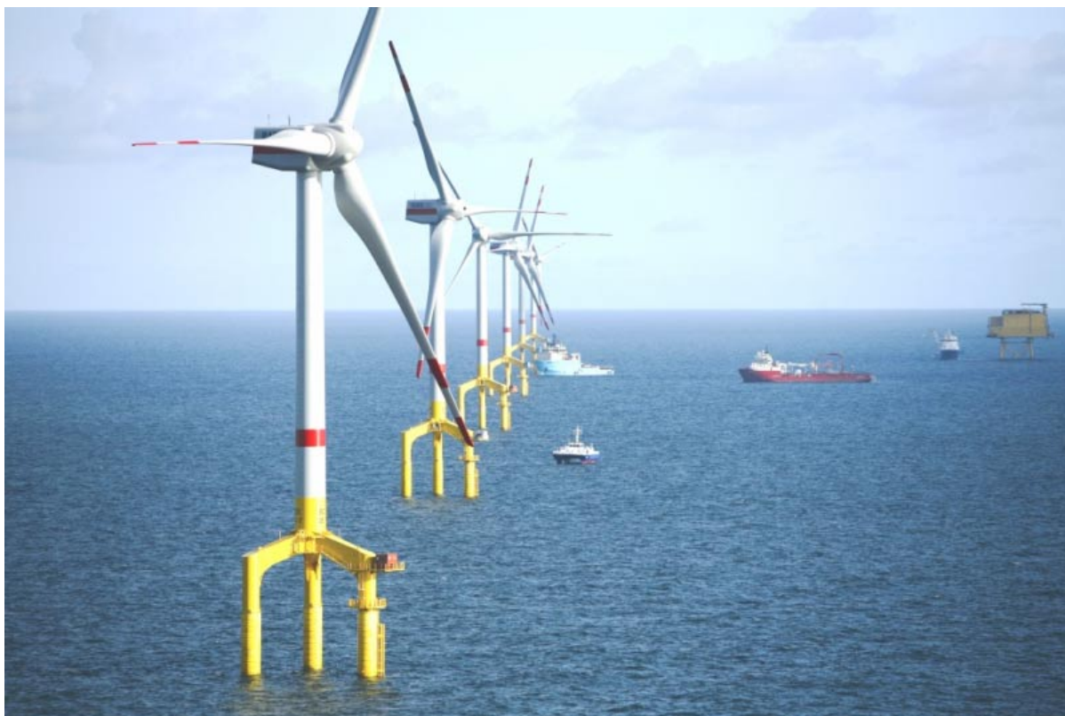
Turbine multi-MW e strutture di fondazione in mare, cofinanziate dall'EEPR, installate nel sito Bard I in acque tedesche del mare del Nord.

Un altro progetto di grande importanza per l'industria europea è un centro di prova per turbine e strutture eoliche in mare, che sarà impiantato ad Aberdeen. Sono stati compiuti progressi significativi nel processo di autorizzazione e nella definizione di strutture giuridiche e commerciali per la gestione degli impianti di prova.