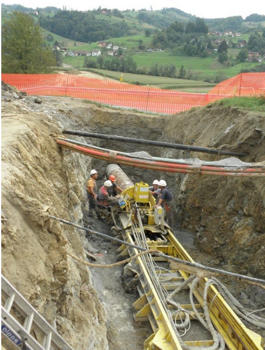
Lavori di miglioramento del sistema di trasmissione del gas in Slovenia, fra la frontiera con l’Austria e Lubiana