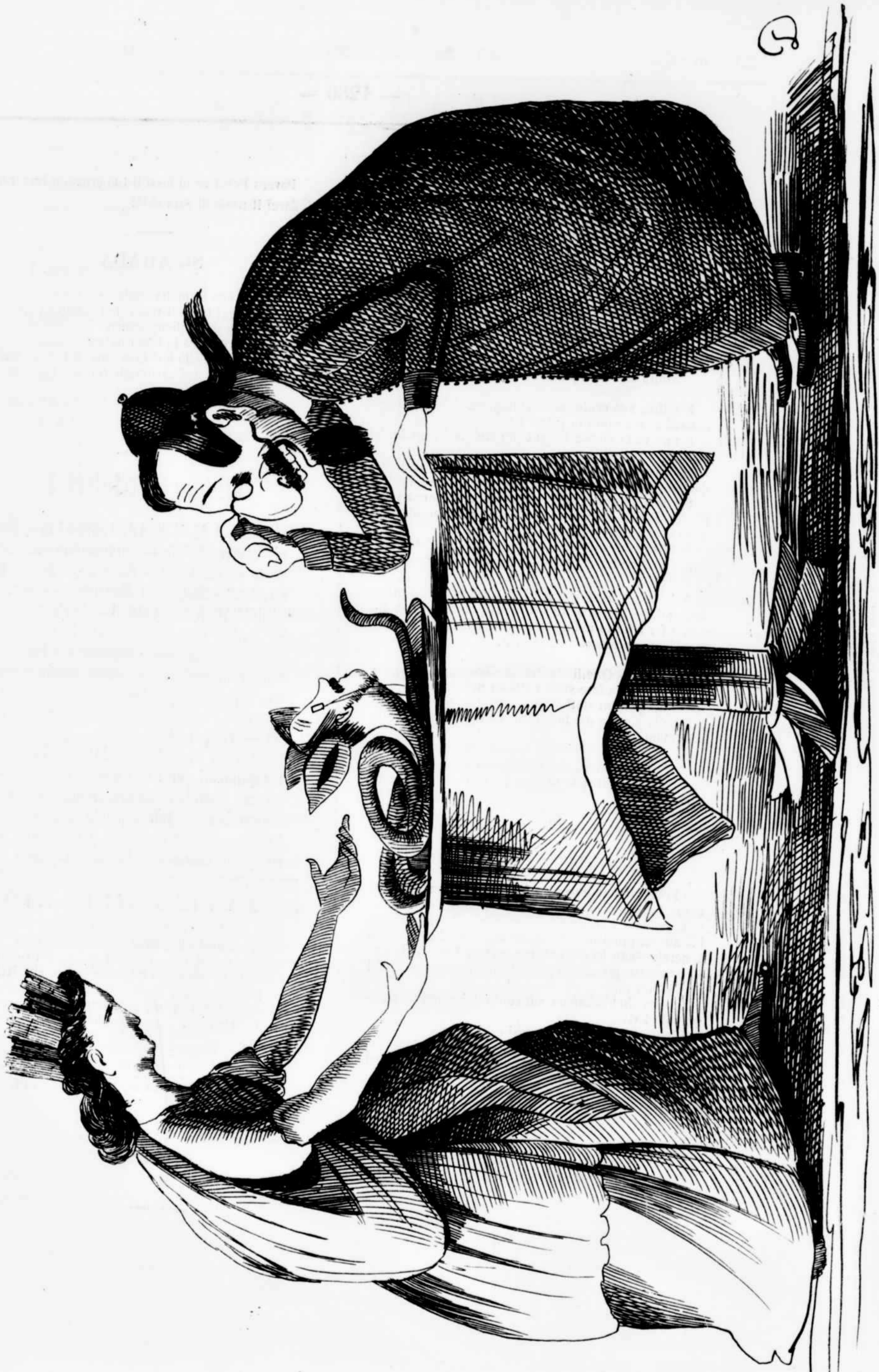
È autta robba chesta - Capitune co li recchie (regalo di Natale al Magnanimo Alleato)