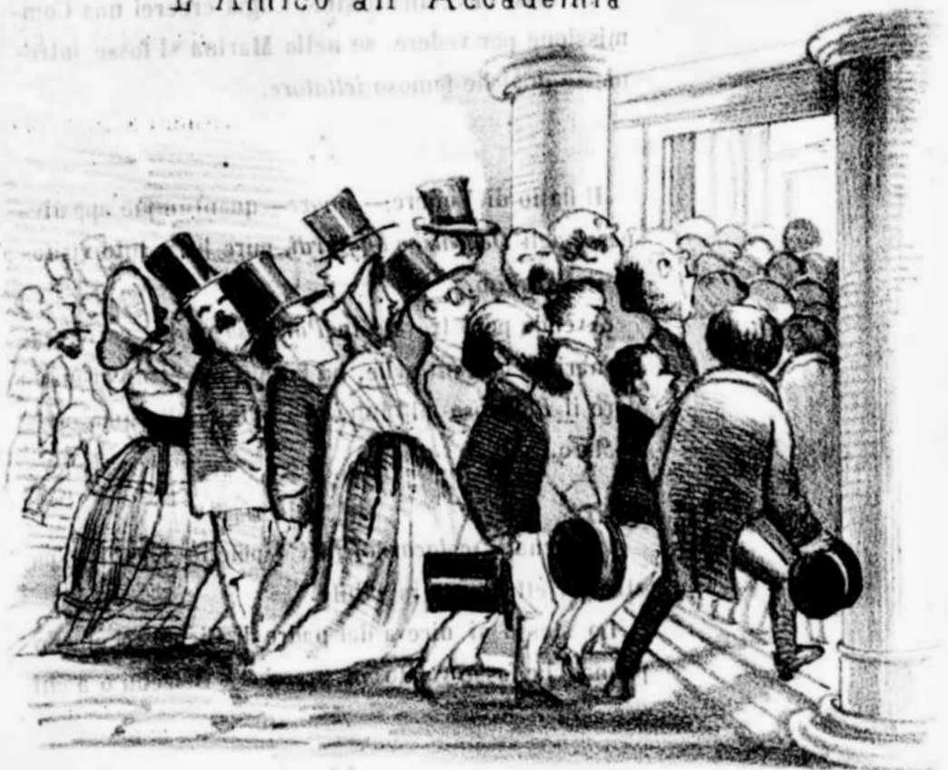
Il Miserere al Gesù Nuovo