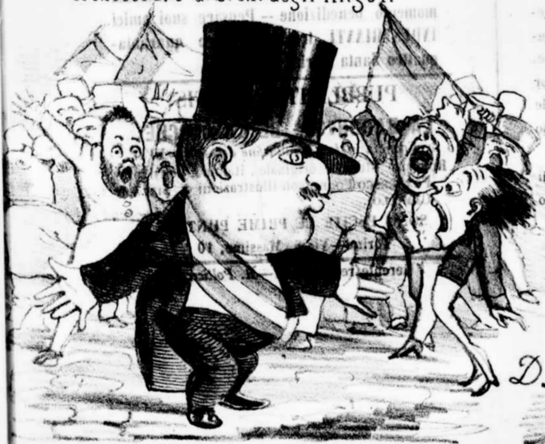
Signori... Circolate, e lasciate Circolare ....