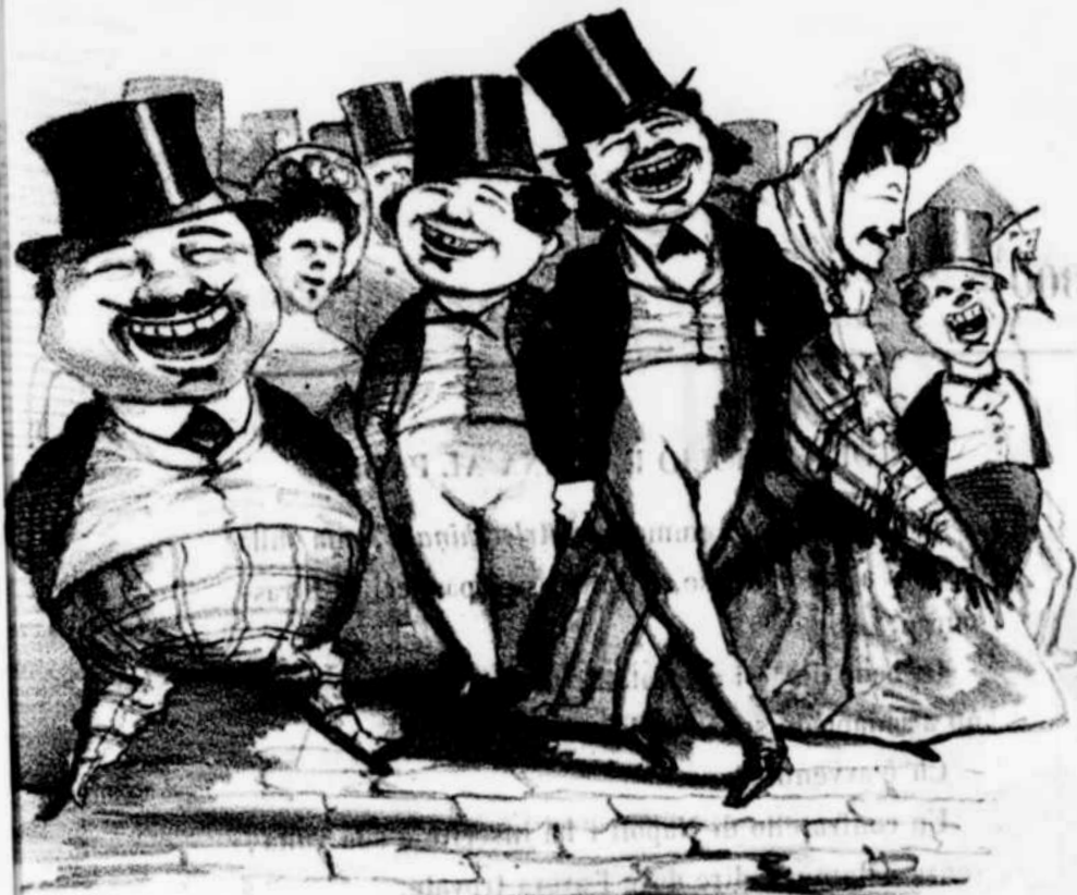
Effetti dello scoppio di una bomba di carta