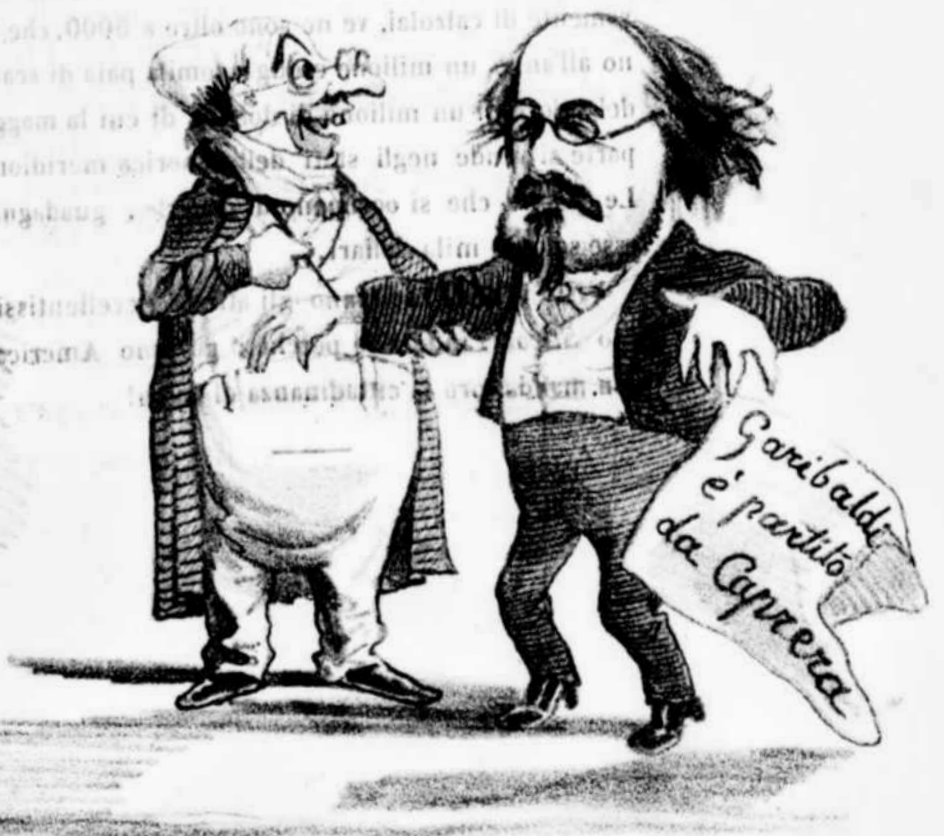
Direte che è per effetti di reumatismo