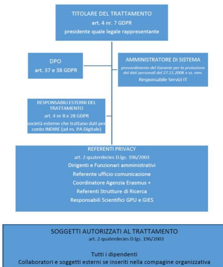
Figura 2 - Organigramma privacy

A decorrere dall'anno 2020, l'Ente ha strutturato un'apposita organizzazione per la tutela della privacy , con un organigramma dedicato di seguito rappresentato figurativamente.