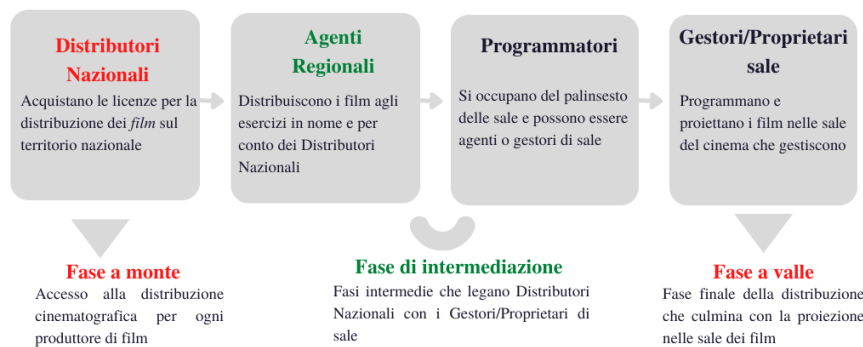
Figura 1. Filiera della distribuzione cinematografica

Tali fasi della filiera distributiva, dal punto di vista antitrust , costituiscono altrettanti mercati rilevanti, così come indicati nelle prassi dell'Autorità e della Commissione Europea: